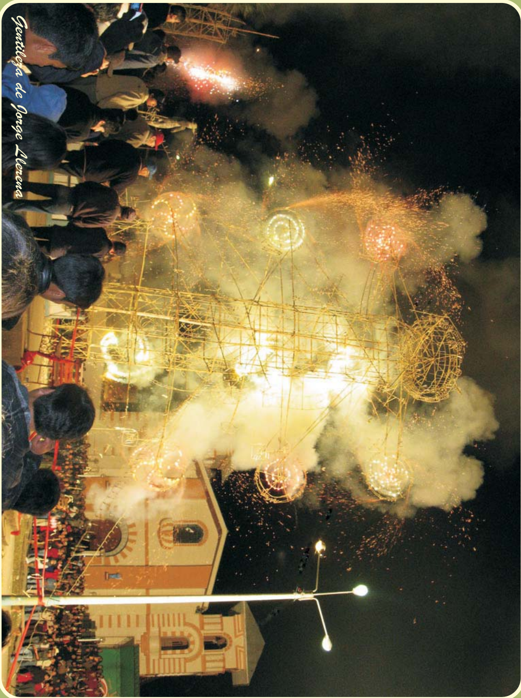
gentileza de Jorge Alencara